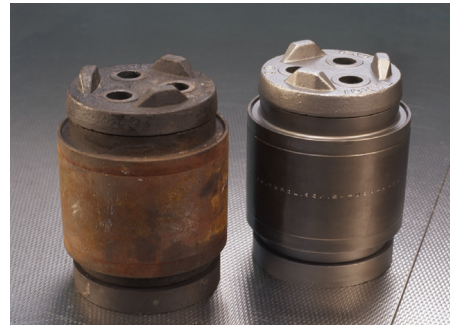
TAROL-Einheit (gebraucht und aufbereitet)